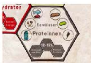
WHY GOOD FOOD AND LOOP?