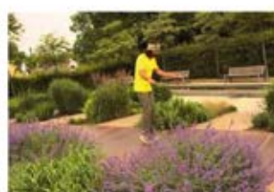
LOOP VUN DER WOCH

"Wild Cooking" an Iddien zum Iessen déi Spaass maachen.