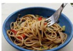
FOOD VUN DER WOCH

"Wild Cooking" an Iddien zum Iessen déi Spaass maachen.